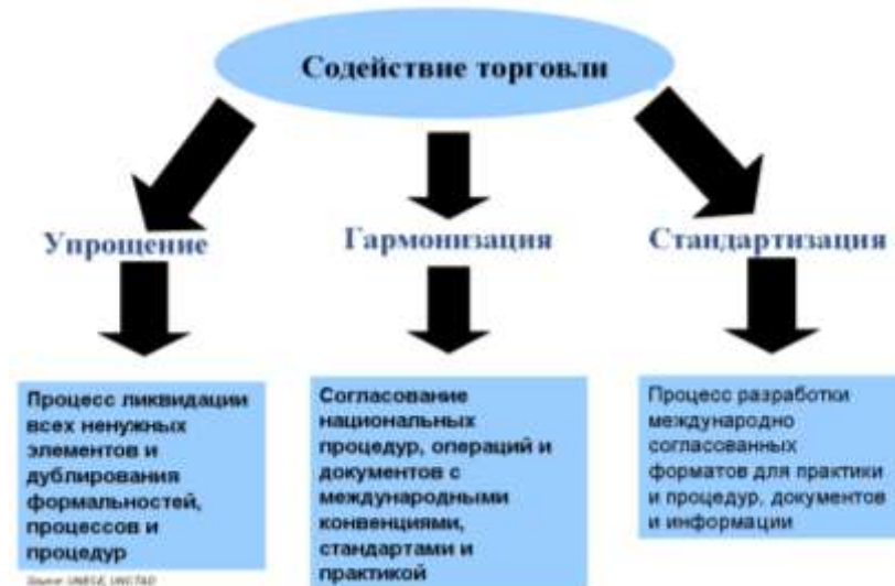
Рисунок 1. Направления содействия упрощению торговли.

Содействие упрощению торговых процедур через: